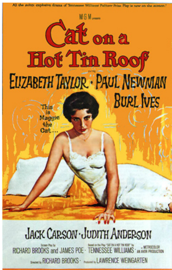
Cat on a Hot Tin Roof film poster

Планы занятий / Критическое мышление / Критическая реакция / Урок 3